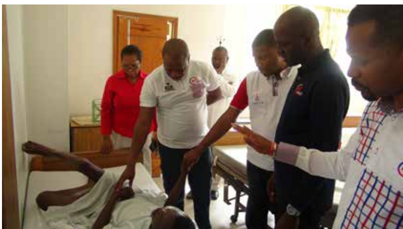
▲ Visite des pasteurs organisateurs d'un patient avant intervention chirurgicale

L'action chirurgicale devait être poursuivie après notre départ d'Haïti, avec les offrandes laissées par nos leaders.