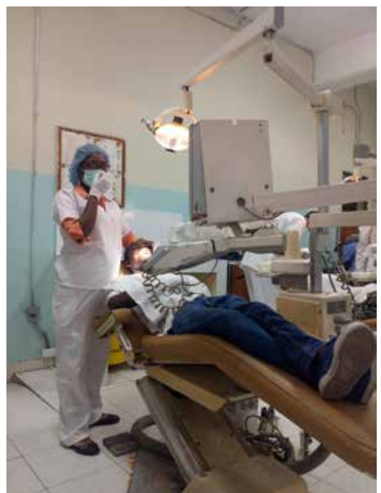
Intervention chirurgicale dentaire ►